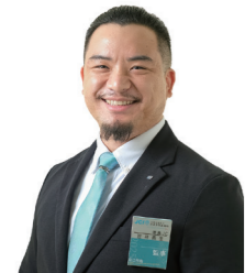
サマーコンファレンス特別委員会 副委員長 (VC)